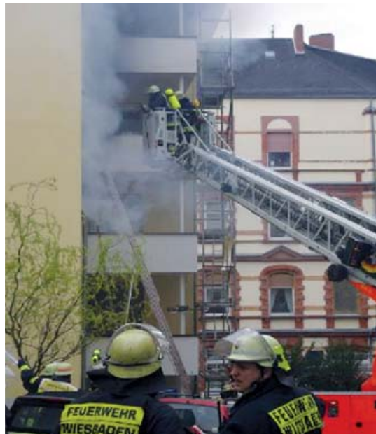
Slika: Vatrogasce Wiesbaden

Oni nesprecavaju vatru al osete miris i daju nama signal i mogucnost da iskoristimo to kratko vreme za spasavanje.